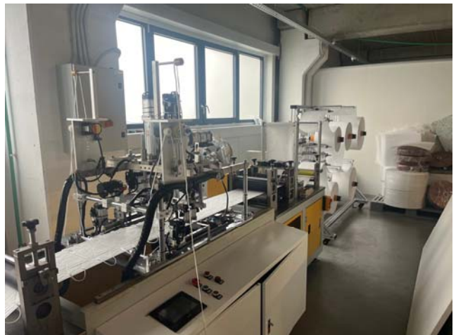
Slika 19. - 26. Fotografije unutrašnjeg prostora, dio strojeva za proizvodnju zaštitnih maski