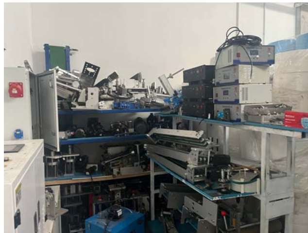
Slika 15. i 16. Fotografije unutrašnjeg prostora, dio strojeva i opreme, rastavljen i neobilježen