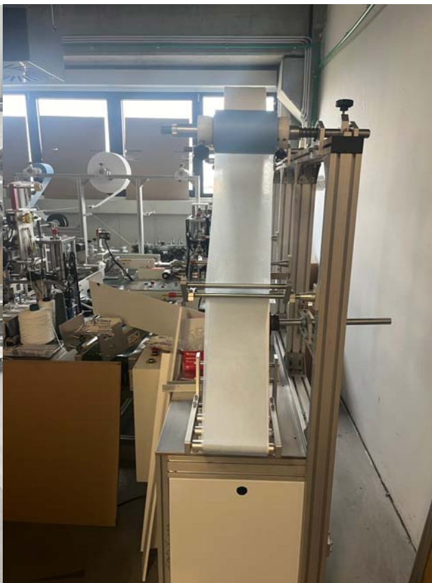
Slika 17. i 18. Fotografije unutrašnjeg prostora, dio strojeva i opreme nepoznatih značajki, isključivo namijenjenih proizvodnji zaštitnih maski, nepoznatog tehničkog stanja