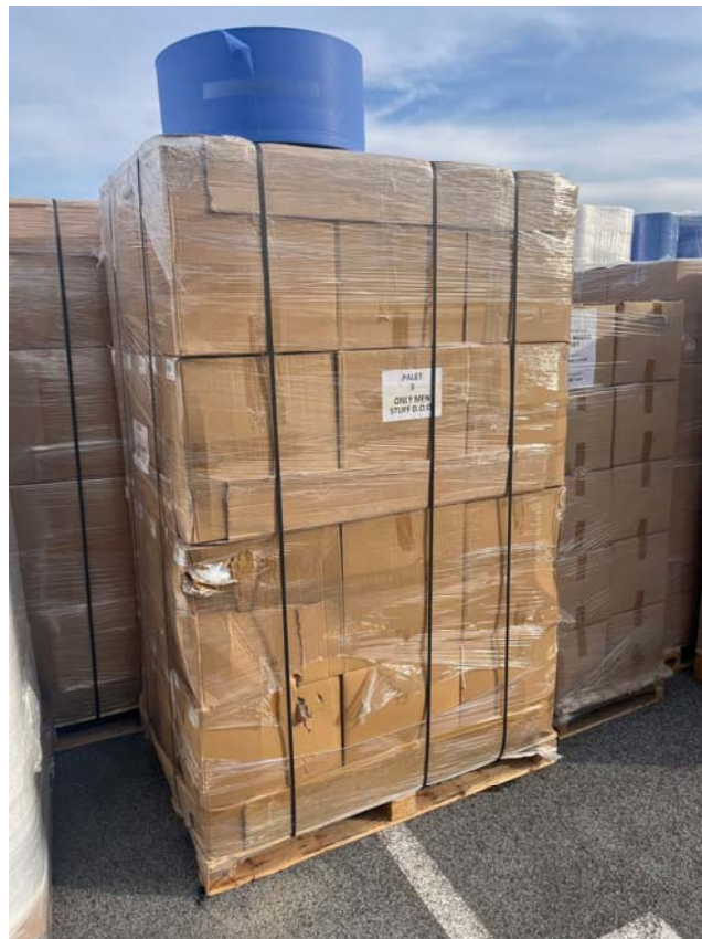
Slika 1. – 12. Fotografije vanjske lokacije, dio paleta s gotovim proizvodima, dio s repromaterijalom

Istom prilikom su obišli i pregledali unutrašnji proizvodno-skladišni prostori, te su i tom prilikom snimljene sljedeće fotografije.