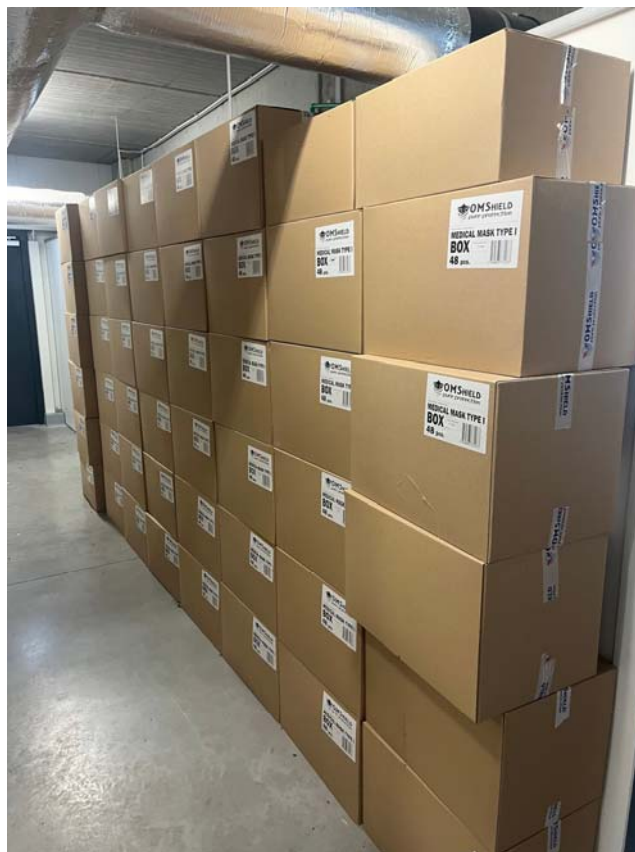
Slika 13. i 14. Fotografije unutrašnjeg prostora, kutije s gotovim proizvodima