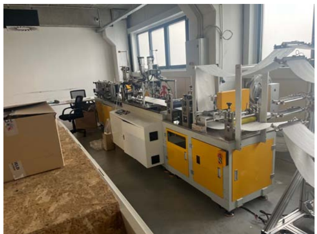
Slika 27. i 28. Fotografije unutrašnjeg prostora, dio strojeva za proizvodnju zaštitnih maski